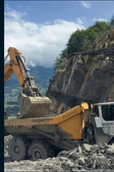
Steinbruch, Guber Natursteine AG